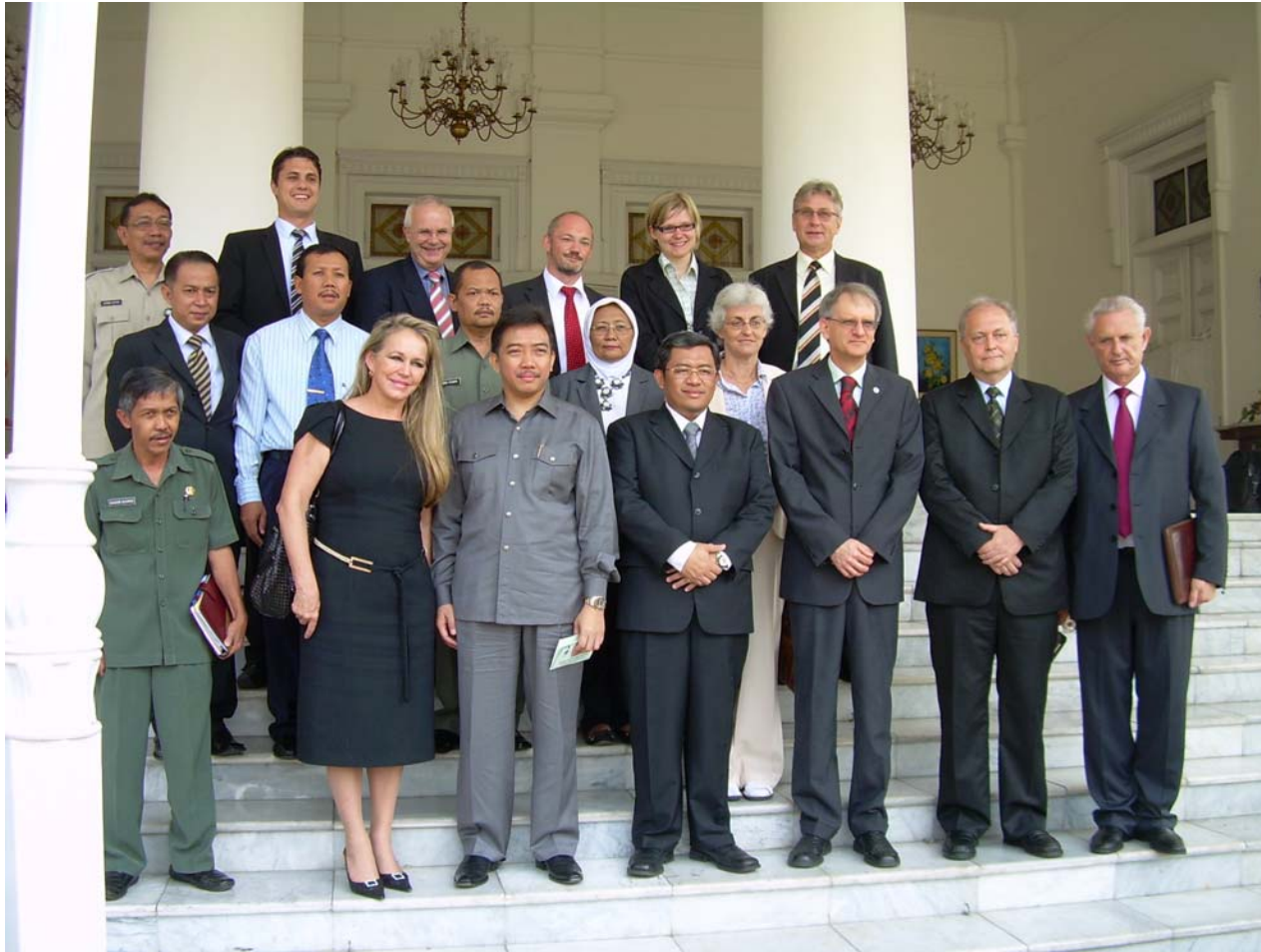
Wagner Textilmaschinen und Zubehör GmbH

Der Gouverneur der Provinz West Java, Herr Ahmed Heryawan, empfing die deutschen Unternehmer vor Beginn der Veranstaltung in Bandung am 21.10.2009 in seiner Residenz. Er zeigte großes Interesse an den Erfahrungen der Unternehmer für die Nutzung alternativer Energiequellen sowie die Möglichkeiten von Abfallrecycling.